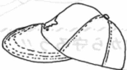
校章(白でししゅう)